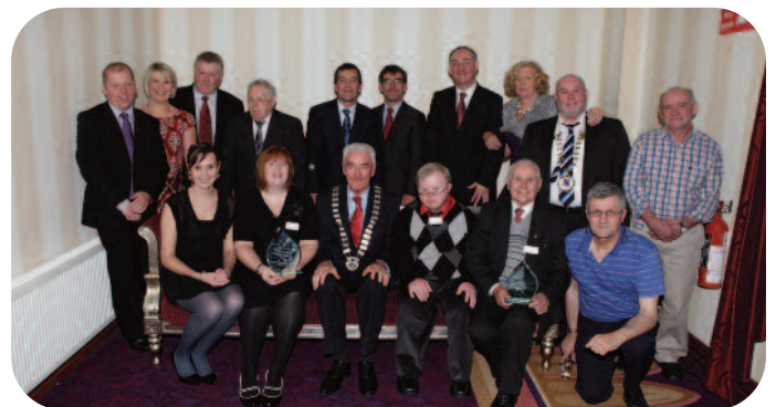
Bród As d'Áit - Buaiteoirí Duaise 2010

Buaiteoir Speisialta Dian-iarrachta an Mholtóra ab ea muintir na háite agus foireann na dTeachíní Glasa, an Sráidbhaile. Roimhe seo, thug teachíní le clanna fostaithe ar Eastáit Bhaile an Bhiocáire atá tréigthe le déanaí agus gráin súl ar an mbóthar go Ceatharlach, thóg Siúracha na Trócaire de chuid Íosa agus Muire orthu féin, i dteannta le Comhairle Chontae Laoise, le Feidhmeannacht na Seirbhíse Sláinte agus leis an bpobal áitiúil sa t-Sráidbhaile, ar thionscnamh a fhorbairt chun na teachíní a athchóiriú agus a chaomhnú, agus áit a fhorbairt, chomh maith, inar féidir le fir agus le mná le míchumas intleachta orthu cónaí leis an gcúram agus leis an dtacaíocht chuí acu laistigh de na Teachíní agus i measc an phobail.