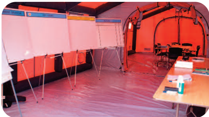
Pobal an Rialtóra Oibríochtaí Bainsitiú Mór-Éigeandála

Bhí trealamh breise agus cumarsáidí soláthraithe do Cheannasaí na Foirne Saothair 'ar suíomh'. Chloígh Comhairle Chontae Laoise le achainí uile na Roinne i dtaobh idir thraenáil inmheánach do Fhoireann an Chontae agus Thraenáil Idir Ghníomhaireacht soláthraithe ag An Roinn.