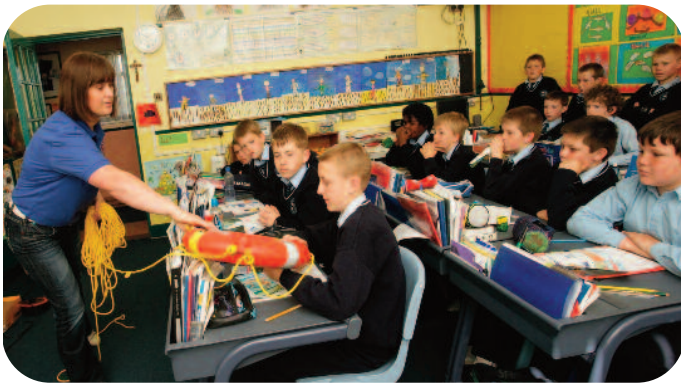
Seachtain Mheabhraíochta Sábháilteacht Uisce – B.S. Bhaile Átha an Róine

Dhein Sábháilteacht Uisce Laoise cuairteanna scoile ar 26 scoil chun a meabhraíocht a ardú faoi uisce. Sí aidhm phríomha an cur i láthair ná teachtaireacht sábháilte a thabhairt do leanaí faoi shnámh agus faoi shábháilteacht uisce le linn laethanta saoire an tsamhraidh. Taispeánadh do na leanaí, chomh maith, conas baoi-fháinne a úsáid agus an tábhacht atá leo i locha, in abhainn agus i linnte mórthimpeall an chontae. Dob iad S.N. Chnocán na Mac Tíre buaiteoirí an chomórtais phóstaer.