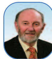
John Bonham