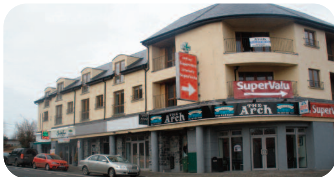
Aonaid Cuid V ag Radharc an Ghleanna, An tSráid Bhaile

De réir Chuid V den Acht um Pleanáil & Forbairt 2000, tógadh 2 n-aonad tithíochta (sóisialta) i 2010.