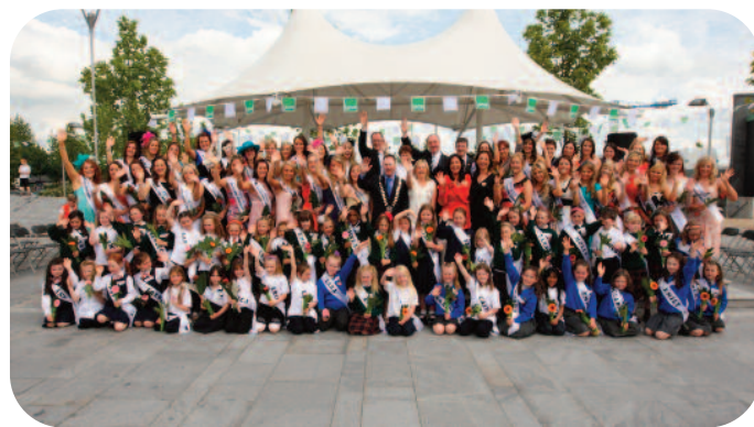
Craobhchomórtas Réigiúinacha den Rose of Tralee 2010