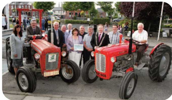
24 Meitheamh 2010 – Fáiltiú an Chathaoirligh in onóir an Ghrúpa Red Eagles