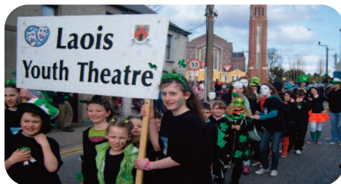
Amharclann Óige Laoise ag glacadh páirt i Paráid Lá 'Le Pádraig

D'oibrigh Amharclann Óige Laoise i bPort Laoise, sa tSráidbhaile, i Maighean Rátha, i gCúil an tSúdaire agus i Ráth Domhnaigh le linn na bliana. I dteannta le siopaí oibre bhliantúla, bhí taibhiú spleodrach deireadh na bliana ar siúl ar thalamh Cúirt loma ar an 29ú Bealtaine.