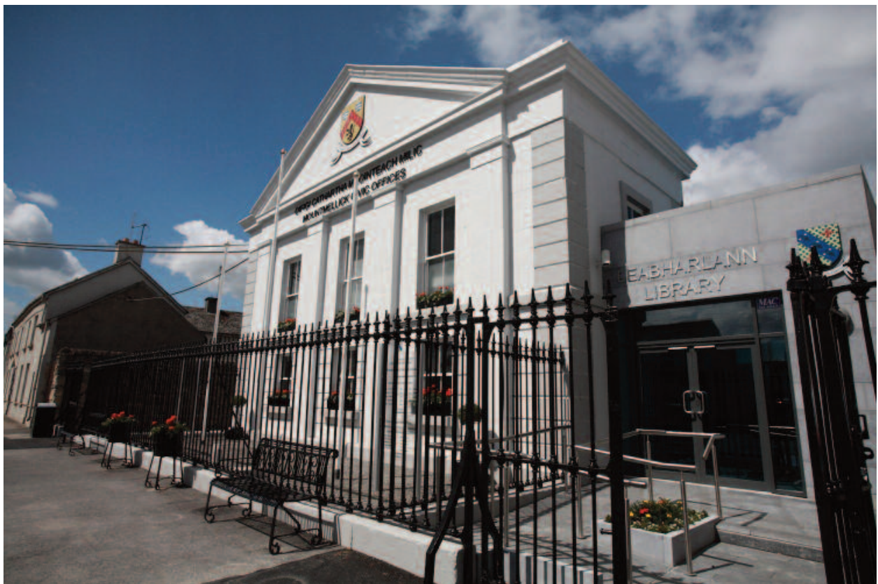
Leabharlann Mhóinteach Mílíc agus an Áiléar Ealaíona