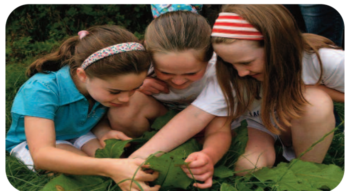
Siúlóid na Seachtaine Oidhreachta ar an Chanáil Mhór, Baile an Bhíocáire

Bhí clár faid-seachtaine d'ócáidí clanna, siúlóidí stiúrtha, cainteanna, taispeántais sleamhnán agus laethanta taitneamhacha eagraithe don tSeachtain Oidhreachta náisiúnta i Lúnasa