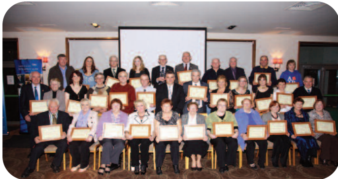
Duaiseanna Pobail 2010 – Ainmnithe & Buaiteoirí

Dhein Fóram Pobail Laoise óstaíocht ar a dara Searmanas Bliantúil Duaiseanna Pobail & Deonach ar an 3ú Samhain, 2010 in Ostán Chill Uisean, Port Laoise. Bhí an Searmanas ar siúl, chomh maith, i dteannta le hOifig Oidhreacht Chomhairle Chontae Laoise agus le Páirtíocht Spóirt Laoise agus tá i gceist aige an chabhair mhór a thug na grúpaí pobail agus deonacha do Chontae Laoise a aithint.