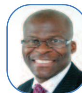
Rotimi Adebari (Non Party)