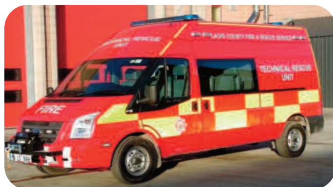
Aonad Slánaithe Teicniúil

Seachadadh feithicil aonad tarrthála teicniúil nua i Mí na Nollag go mbeidh trealamh tarrthála speisialta ann. Leanadh leis an gclár uasghrádaithe trealaímh dóiteáin nuair a cheannaíodh trealamh tarrthála tionóisc bhóthair, fearas cumarsáide agus aiseanna traenála.