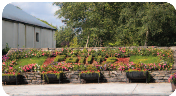
Maighean Rátha – Buaiteoir Iomlán Chomórtas na mBailte Slachtmhara 2010

Bunaíodh Cónaidhm Laoise de Bhailte Slachtmhara i 1998 agus faoi láthair tá 26 grúpa cláraithe. Caomhnaíonn agus na bailte seo an comhshaoil áitiúil ina bpobal agus cuireann siad feabhas air, agus dá bhrí sin is acmhainn luachmhar iad. Tá Comhairle Chontae Laoise i mbun oibre gníomhach le Coistí na mBailte Slachtmhara chun cabhrú le hinsealbhú sa todhchaí agus chun fás agus forbairt leantach a chinntiú.