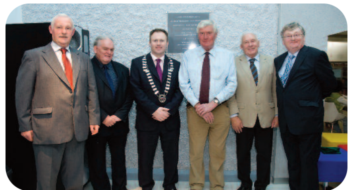
Oscailt Oifigiúil Leabharlann Mhóinteach Mílíc & Áiléar Ealaíona

Bhí Leabharlann Mhóinteach Mílíc agus an Áiléar Ealaíona oscailte go hoifigiúil ag John Moloney, T.D. Aire an Míchumais agus Sláinte Inchinne i Meitheamh.