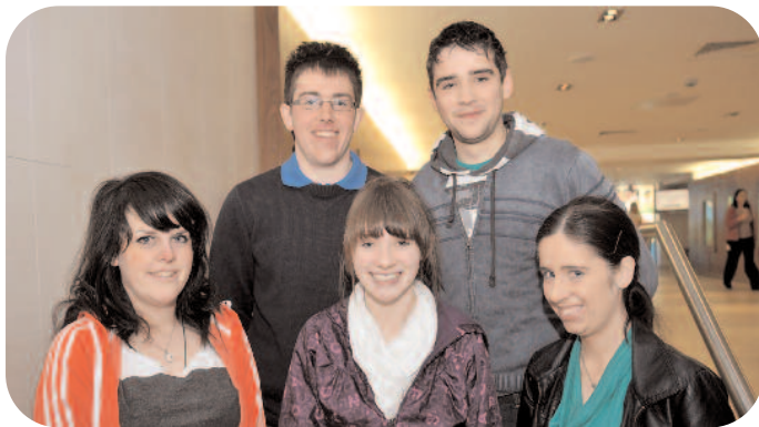
Ionadaithe Dháil na nÓg Laoise