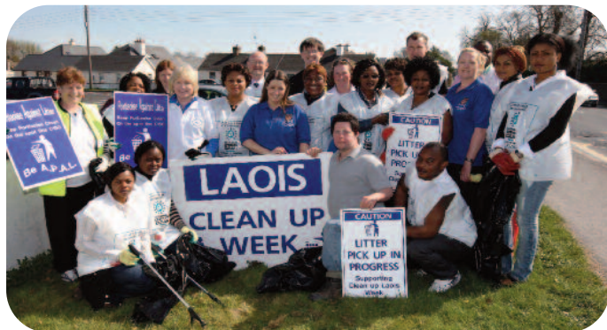
Seachtain Ghlantacháin Laoise

Rith Seachtain Glanadh Suas Laoise ón 12ú go dtí an 16ú Aibreán 2010. Eagraithe i dteannta le Glanadh Earraigh An Taisce agus ins an seachtú bliain anois, seo ceann de thionscnaimh glanadh suas na Comhairle is mó agus ghlac an méid daoine is mó riamh páirt ann i 2010.