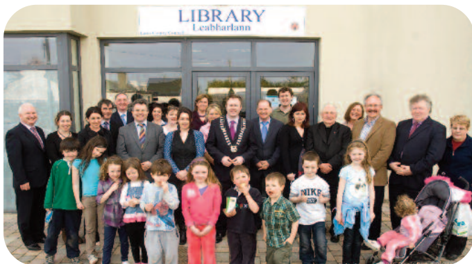
Oscailt Oifigiúil Leabharlann Bhaile Uí Laigheanáin