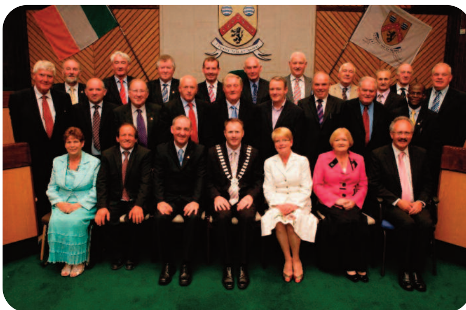
Baill Tofa leis an Bainisteoir Contae ag CCB Comhairle Contae Laoise – Meitheamh 2009

Tá 25 Comhalta Tofa i gComhairle Contae Laoise - ceithre chomhalta an duine ó Thoghcheantair Mhaointeach Milie, Ioma agus Log an Churraigh, seacht chomhalta ó Thoghcheantar Phort Laoise agus sé gcomhalta ó Thoghcheantar Bhuiríos Mór Osraí.