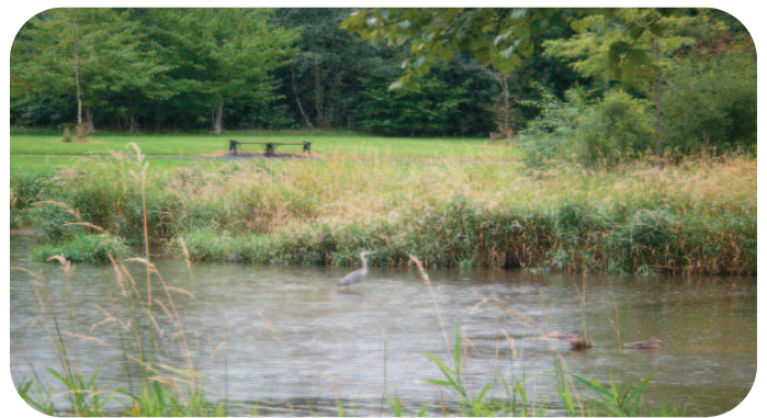
Abhainn agus Loch Pháirc na nDaoine

Leanann Páirc na nDaoine agus Páirc Abhainn Tríoge agus an tSiúlóid Líneach i mBaile Phort Laoise ag soláthar spáis oscailte chaitheamh aimsire do mhuintir na háite agus do chuairteoirí. An bhliain seo bhí na Páirceanna lán de fhiabheatha in ainneoin titim sneachta agus báistí troime le linn na bliana. Tá éin bheaga gairdín, ealaí, lachain, spá-gaire tonn agus corr réisc mar chuairteoirí rialta, ag baint taitneamh as an suaimhneas ar an loch. Tá gléas aclaí agus cleachtadh na ndaoine fásta i ngach ceann den dá pháirc mar bhuntáiste don a lán daoine a úsáideann na sórtanna difriúla gléasra gach lá. Cabhraíonn an trealamh aclaíochta leis an bpróiseas athshlánaithe ó bhreoirteacht nó ó obráid.