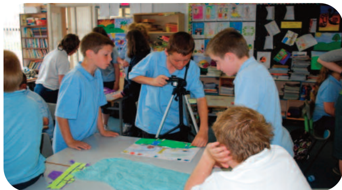
Tionscnamh Ealaíontóirí i Scoileanna Bhuiríos Mór Osraí

Reáchtáladh an Scéim Ealaíontóirí i Scoileanna i 10 scoil i rith 2010. Leis an scéim seo tugtar deis do na daltaí taithí chuimsitheach a bheith acu le healaíontóirí proifisiúnta agus freisin chun taithí a fháil ar mheáin ealaíona difriúla. Thug an Oifig Ealaíona, i bPáirtíocht leis an gComhlacht Amharclanna Oideachais Cupáin agus Corónacha, an deis do dhá scoil sa chontae páirt a ghlacadh le comhlacht amharclanna ar thuras faid is a bhí siopaí oibre ar siúl acu agus bhronnadar dráma a glaoth 'Blennie and the Water Daughter' air.