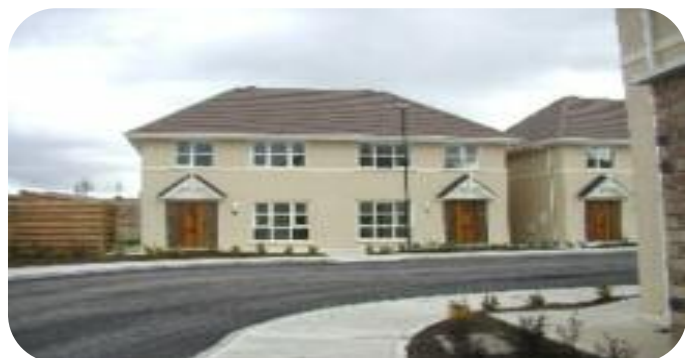
Sráidbhaile Maryborough, Port Laoise.

I 2011 cheadaigh An Roinn Chomhshaoil, Pobail agus Rialtais Áitiúil aistriú sé cinn d'aonaid in-acmhainne i bPort Laoise ina stoc sóisialta. Faoi láthair tá tithe ar an margadh i Sráidbhaile Maryborough, Port Laoise ar phraghas chomh h-íseal le €89,000. Is féidir sonraí breise a fháil fúthu ar www.laois.ie .