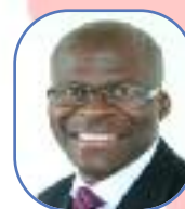
Rotimi Adebari (Non Party)