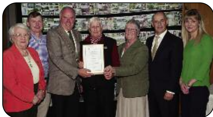
Na Dámhachtainí Comhshaoil