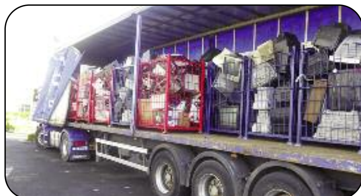
Lá na Vaigíní Beaga