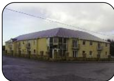
Cúirt an Mhuilinn Nua