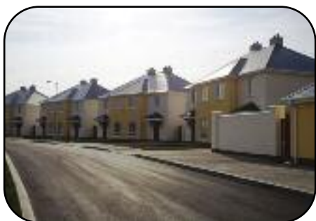
Bealach na Clóidí

Tacaíocht a chur ar fáil do thionscadail phobail a bhaineann le tithíocht shóisialta