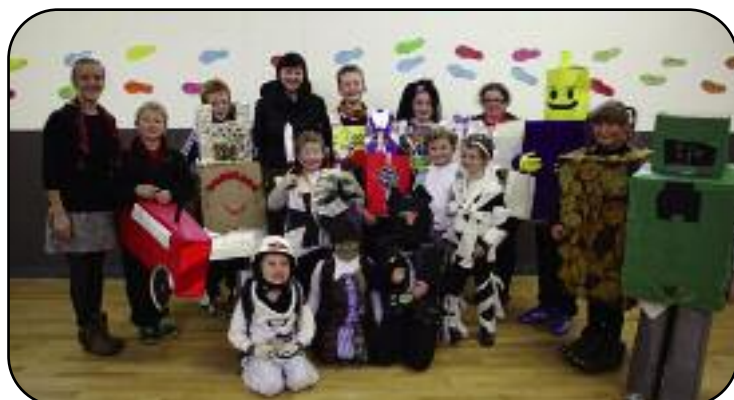
Clár Athúsáide á ndéanamh ag scoileanna