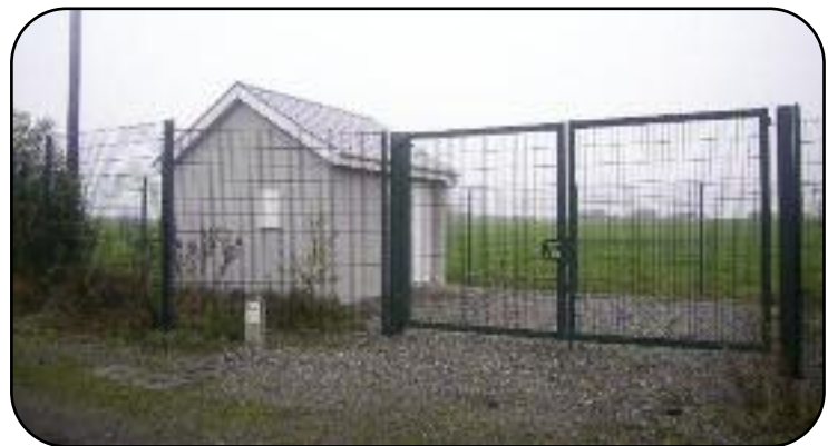
Teach Caidéil Raoire a uasghrádaíodh in 2013