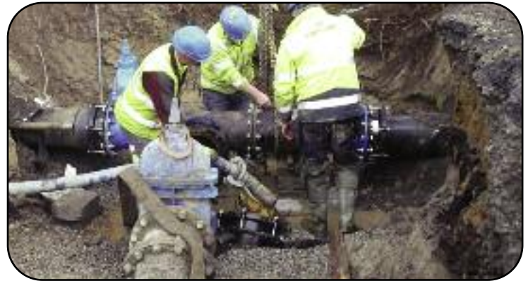
Tionscadal Liosta Beart Leasúcháin Phort Laoise – Píobán á leagan sa Sián