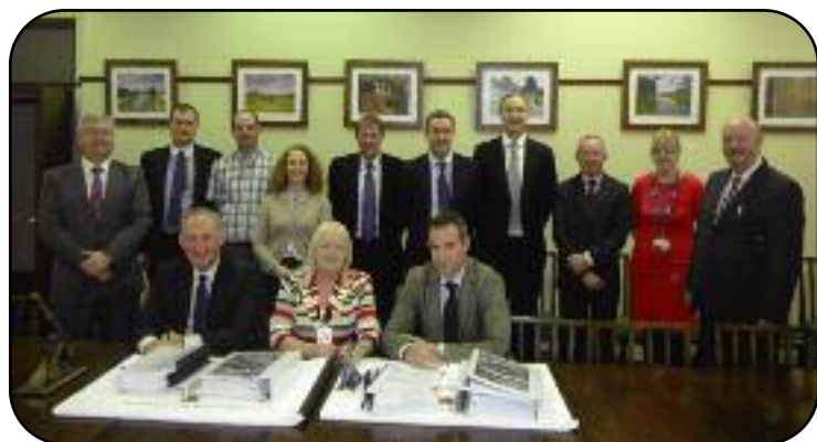
Líonra Bailte Laoise – Conradh á shíniú