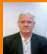
Aidan Mullins (Sinn Féin)