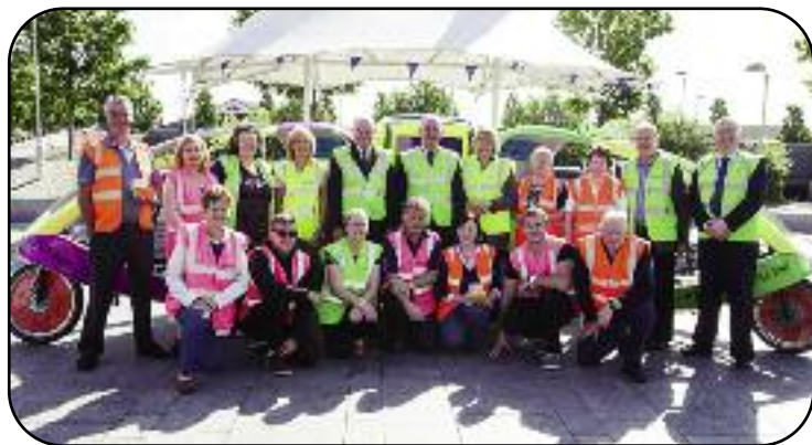
An Tascfhórsa um Bruscar Guma á sheoladh in 2014