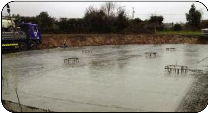
Taiscumar Knocks á thógáil

Bainfidh Comhairle Chontae Laoise an méid sin amach trí na hacmhainní foirne agus pearsanra araon a theastaíonn chun an ról atá aici mar Údarás Maoirseachta faoi na Rialacháin um Uisce Óil 2014 ón Aontas Eorpach a chomhlíonadh